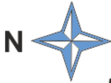
СХЕМА ТРАСИ ЗМАГАННЯ